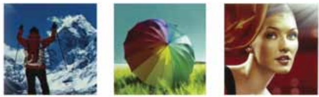
La luminosidad del color es significativamente inferior a la del blanco

Fotos reales de imágenes proyectadas desde una fuente idéntica de señal. El precio, la resolución y la luminosidad del blanco son similares en ambos proyectores (Epson 3LCD y competidor DLP de 1 chip). Ambos proyectores han sido ajustados a su modo más luminoso.