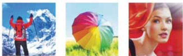
Alta luminosidad del color y del blanco